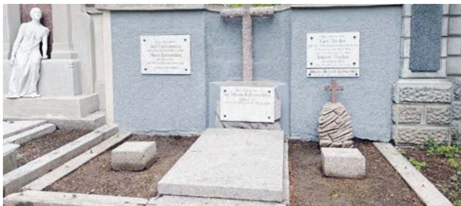
Příklad jedné z hrobek, jak vypadala před rekonstrukcí a po.