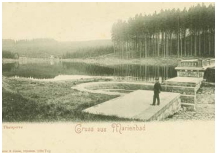
Hráz vodní nádrže z kamenného zdiva