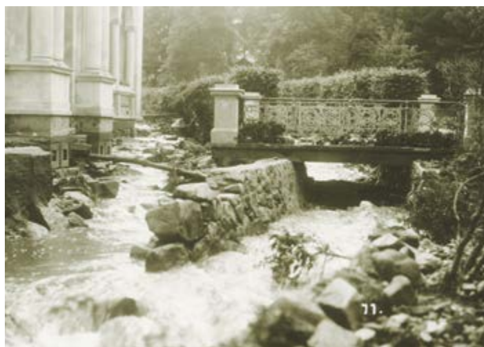
Běsnící živel napáchal značnou škodu