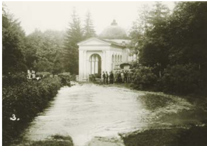
Povodeň v oblasti Lesního pramene