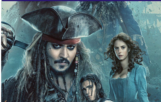
Piráti z Karibiku: Salazarova pomsta (Dobrodružný, USA, 2017, 126 min., premiéra, české znění / titulky)

On-line rezervace vstupenek na www.kinoslavia.cz Pokladna kina otevřena denně od 14:00 do 20:00 hod. Změna programu vyhrazena.