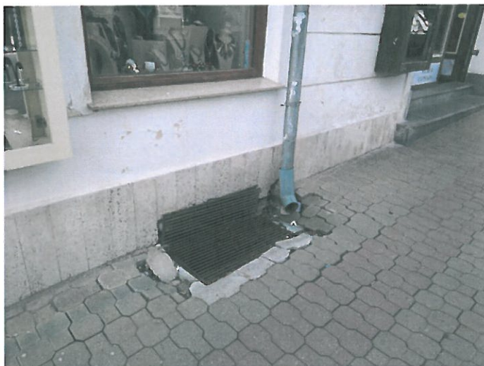
Hlavní třída (nad Caffè Moda) -nezabezpečené mříže