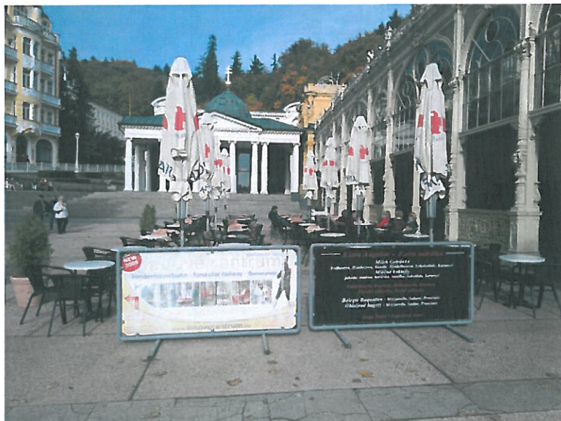
Kolonáda – kavárna (terasa) -nevzhledné a vybledlé cedule