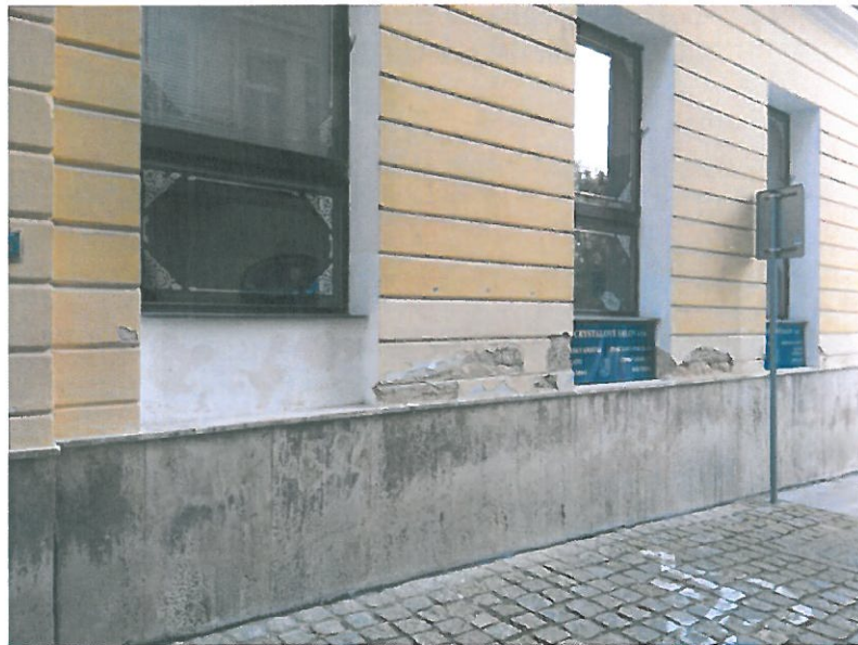
Budova Děkanského úřadu -poškozené zdi