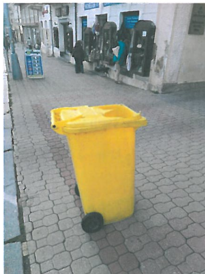
Hlavní třída (pod bankou ČSOB) -poškozená popelnice stojící uprostřed chodníku