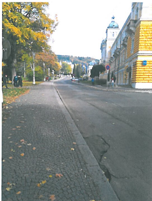
Silnice ke Casinu a Novým lázním -chybí přechody pro chodce