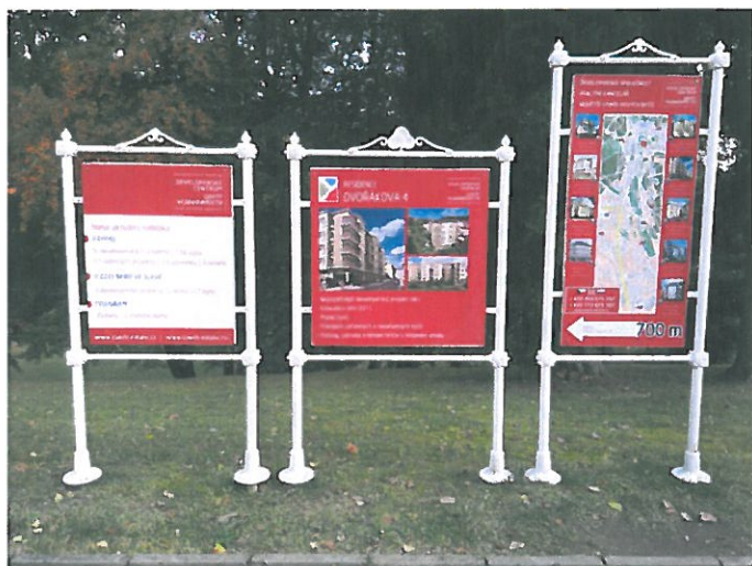
Cedule naproti prodejně LERA -nepříliš vhodné reklamy