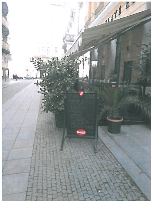
Restaurace u Zlaté koule -cedule