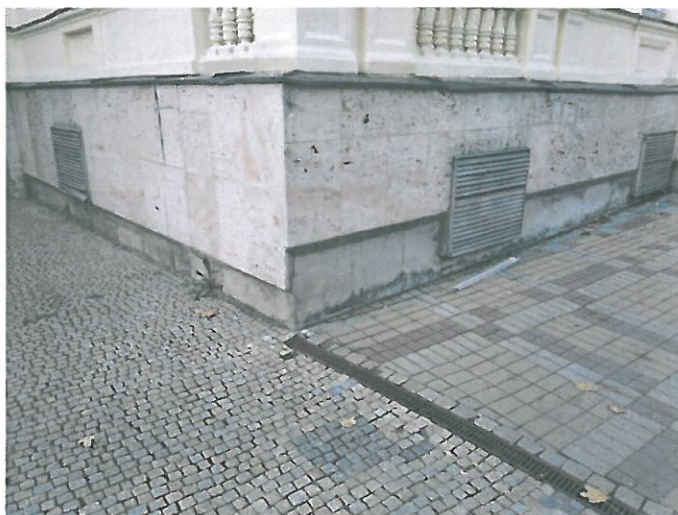
Budova Policie ČR - je třeba lepší údržba budovy