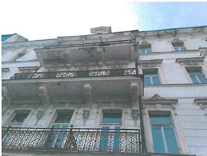
Hlavní třída 41/16 -poškozené balkony domu, nebezpečí pro chodce