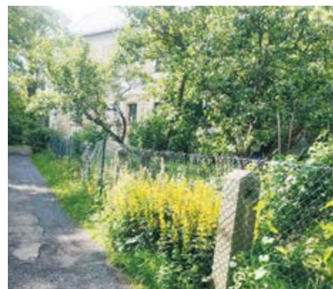
Vrbina tečkovaná je nápadná rostlina, která ráda uniká ze zahrad do přírody.