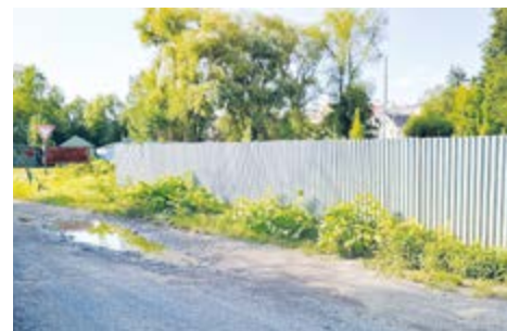
Křídlatka česká zapleveluje krajinu hojně v okolí cest a opuštěných míst.

„Nepůvodními druhy s invazním potenciálem mohou být i méně nápadné druhy. Jako kupříkladu hezká bíle chlupatá červenofialová květina kohoutek věncový ( Lychnis coronaria ). Má domov v Mediteránu, na Blízkém východě a ve Střední Asii.