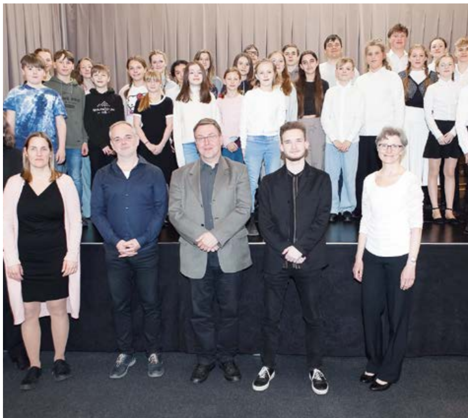
Krajské kolo soutěže lidových nástrojů – soutěžící a porota.