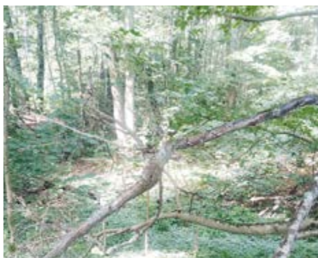
Pitulník postříbřený plně obsadil lesní podrost u hráze Pastervního rybníka u Kynžvartu, kde vytvořil souvislou plochu kolem 700 m 2 .

Vliv nepůvodních a invazních druhů na místní přírodní společenstva je považován za jednu z největších hrozeb pro druhovou rozmanitost přírody. Do Evropy byla většina problematických invadů přivezena záměrně již v 18. a 19. století, ale řada z nich doputovala až ve století 20. a invaze pokračují do současnosti. „Většinou byly přivezeny za účelem pěstování okrasného nebo užitkového. Některým nejdravějším druhům stačilo opravdu málo. Kupříkladu křídlatka japonská ( Reynoutria japonica ), dnes rozšířená po celé Evropě, pochází z několika trsů přivezených v roce 1848 jedním holandským zahradníkem z cesty po Japonsku. Podobnou historii prošly i mnohem mediálně známější invazní druhy jako boševník velkolepý či