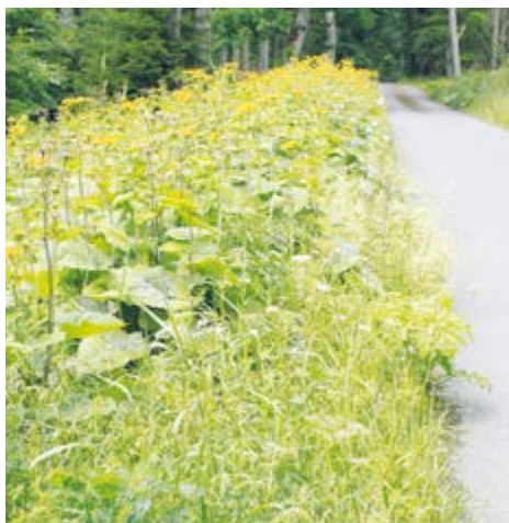
Kolotočnik ozdobný zarůstá slunná místa v Aleji Svobody v Mariánských Lázních.