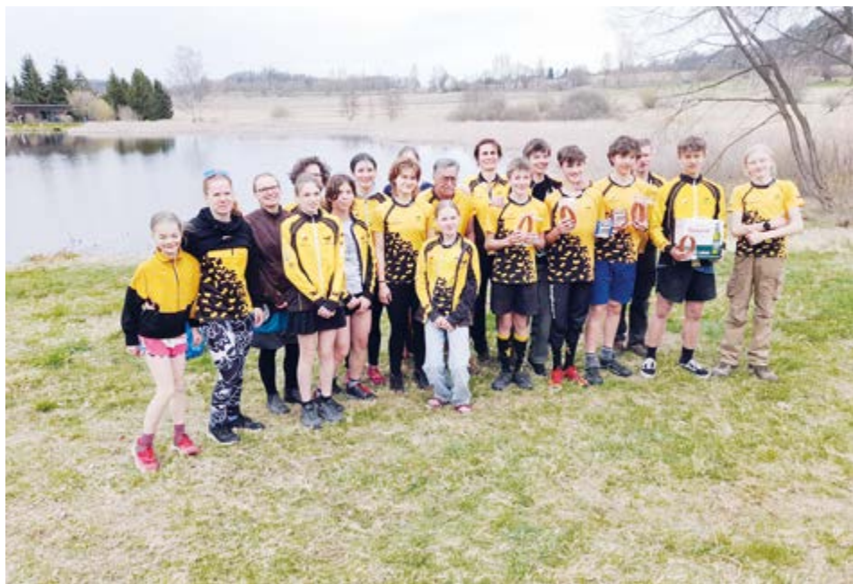
Z posledních závodů u Olšových Vrat.