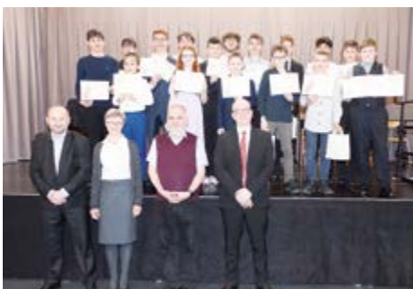
Účastníci odpolední části soutěže žesťů.

Ve čtvrtek 14. března 2025 se v ZUŠ Fryderyka Chopina sešlo 44 žáků ze základních uměleckých škol okresu Cheb, aby soutěžili ve hře na žesťové nástroje. Jednalo se počtem účastníků o mimořádnou soutěž. Výkony jednotlivých soutěžících byly pečlivě připravené. Proto byla atmosféra celého soutěžního dne víc než příjemná pro všechny zúčastněné včetně poroty,