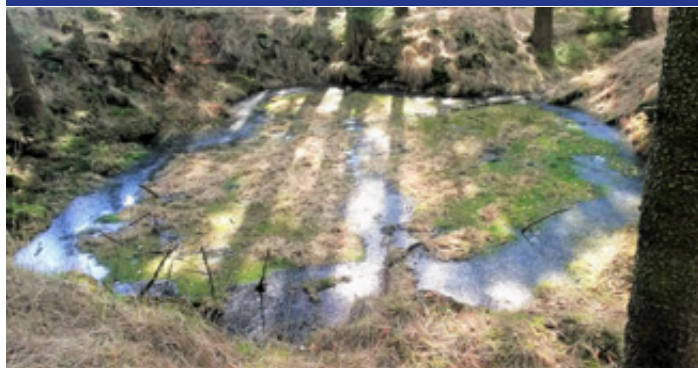
Blízko vyhlídky malé jezírko. Patrně pozůstatek těžby do hloubky. (Snímek Václav Kohout, březen 2020)