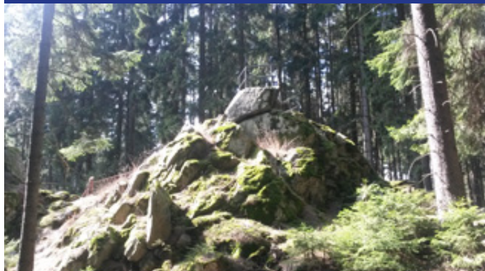
Skalka obklopená stromy. Původně pěkná vyhlídka jižním směrem, nyní zacloněna vzrostlými stromy. Blízko vede cyklostezka 2140. Nebo lze dojít pěšky původní stezkou či podle navigace. Tip na výlet pro milovníky okolí města. (Snímek Václav Kohout, březen 2020)