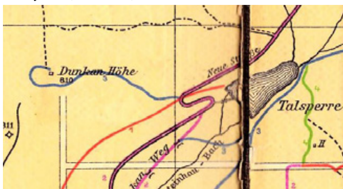
Výsek z meziválečné mapy (1:15 000). Modrá je stezka od přehrady k vyhlídce. Skalka je kótována 810. Červená je silnice od Lunaparku k Nimrodu. (Mapka – sbírka Václav Kohout)