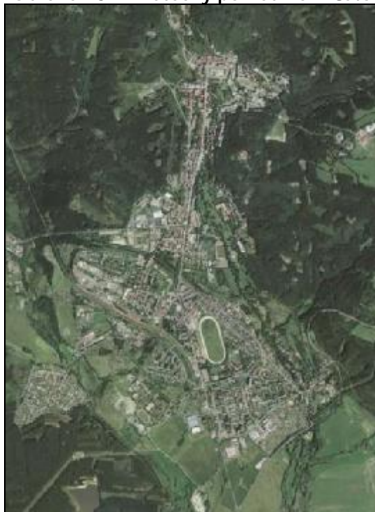
Obrázek č. 1: Letecký pohled na město

V Mariánských Lázních se nachází objekty mnoha stavebních slohů. Dominujícím slohem je novoklasicismus, ve kterém je postavena velká část domů ve městě. Výstavba vyvrcholila na přelomu 19. a 20. století slohem novorenesančním, postavením Nových lázní a Společenského domu Casino. Architektonickým skvostem města je litinová kolonáda z roku 1889. Stavební boom města ukončila 1. světová válka.